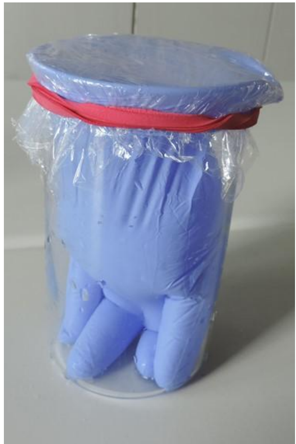
Abb.2: befüllter über ein Becherglas gestülpter Handschuh, abgedeckt