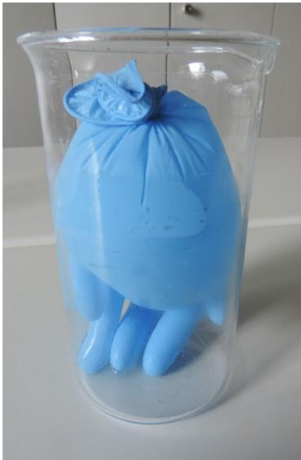
Abb. 1: befüllter verknoteter Handschuh