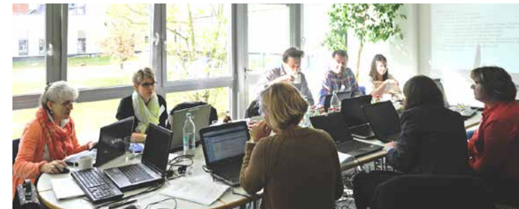
▶ Regionale Arbeitsgruppen