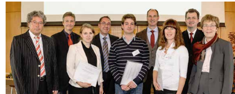
▶ Förderpreis für Jung-Sensoriker