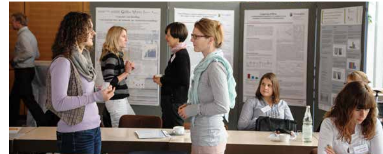
▶ Seminare und Workshops